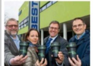
Mewa ist ab sofort neuer Kooperationspartner.

Die Best sucht unter dem Motto „Bewusst genießen“ weitere Kooperationspartner, um den Pappbechern den Kampf anzusagen.