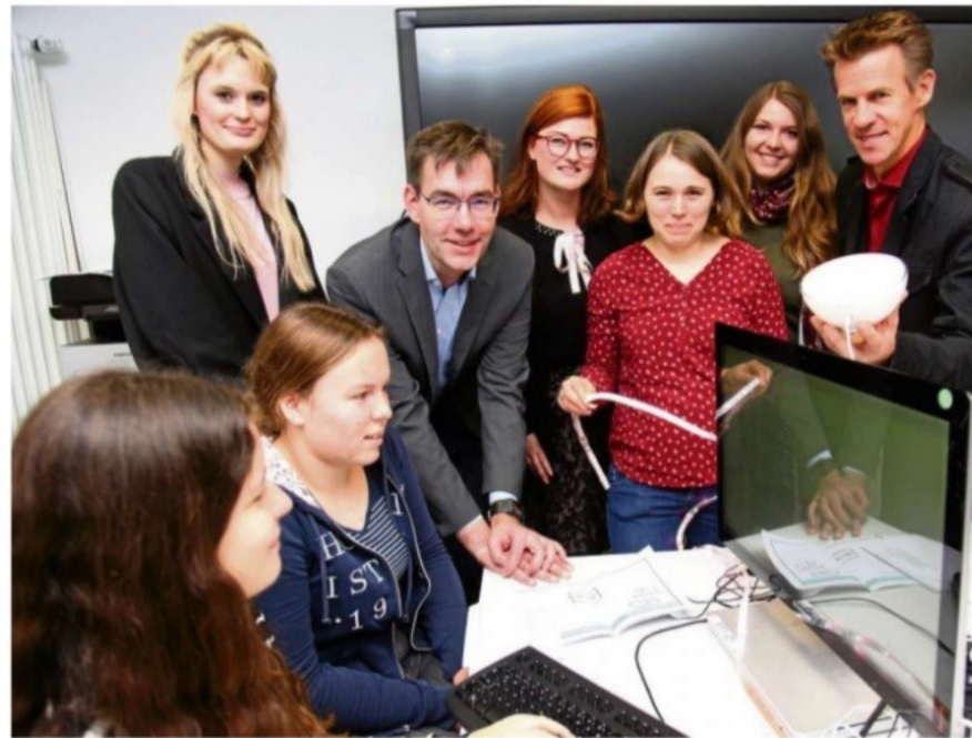
Gespannt verfolgen Leiter und Teilnehmer des Camps die Fortschritte bei den Projekten.

Ein paar Stockwerke unter dem Labor sind unterdessen im Technikum zwei veredelte Autos (Modelle: E 800 und GLE 400) der Firma Bra-